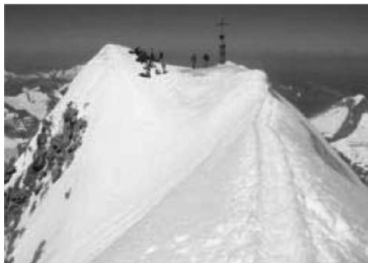
La croce del monte Grossvenediger